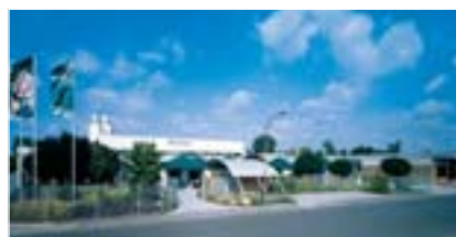
Silikal, Produktion und Verwaltung in Mainhausen